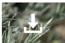
Cœur de Kaolin sur lavandin