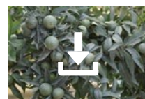
Cœur de Kaolin sur agrumes