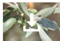
Cœur de Kaolin sur olivier