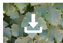
Cœur de Kaolin sur vigne