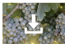
Cœur de Kaolin sur vigne