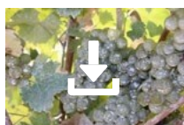
Cœur de Kaolin sur vigne