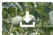
Cœur de Kaolin sur noyer