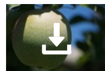
Cœur de Kaolin sur pommier